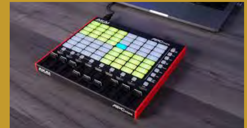
Contrôleur MIDI AKAI Professional APC mini MK2