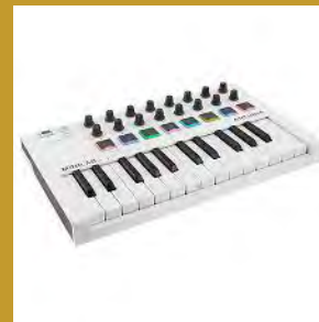
Contrôleur MIDI MiniLab MK2