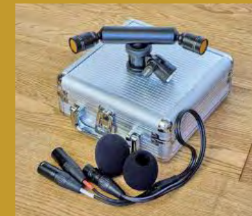
micro Superlux S502