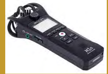
Zoom H1n et H4n pro