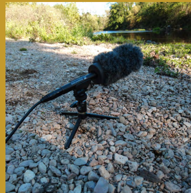
micro Sennheiser MKE 600